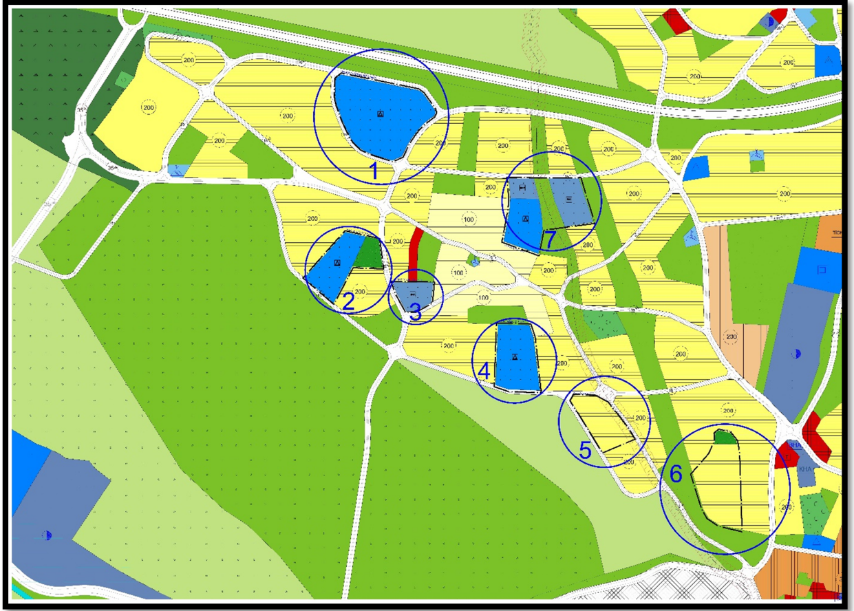
Resim 3. 1/5000 Ölçekli Nilüfer Nazım İmar Planı Değişikliği

Hazırlanan 1/5000 ölçekli nazım imar planı değişikliğinin alan dağılımı aşağıdaki tabloda yer almaktadır.